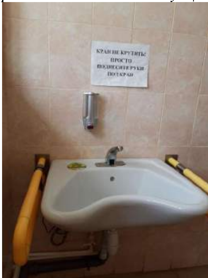
Муниципальное казенное учреждение «Центр помощи детям, оставшимся без попечения родителей» Кизильского муниципального района